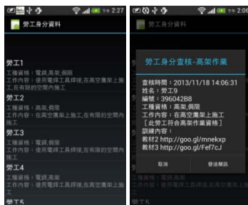
查核勞工身份及顯示門禁資料